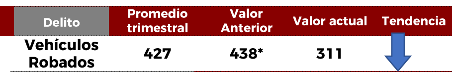
No. de Vehículos Robados (últimos 30 días)