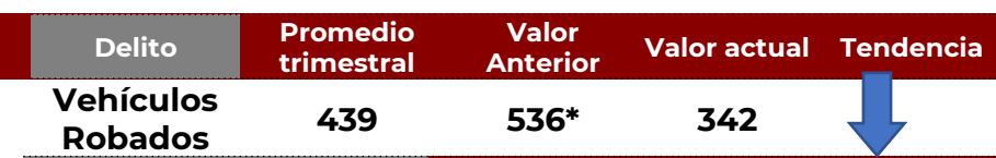
No. de Vehículos Robados (últimos 30 días)