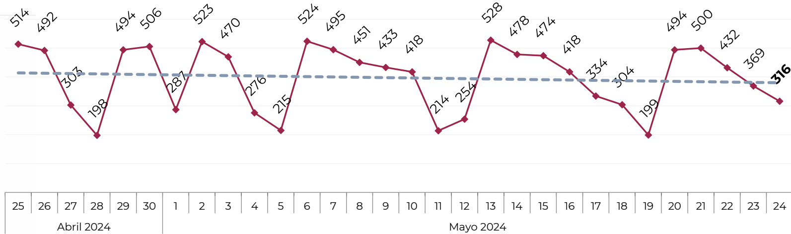
Acumulado por Zona de Vehículos Robados en 2018 , 2019, 2020, 2021, 2022, 2023 y 2024