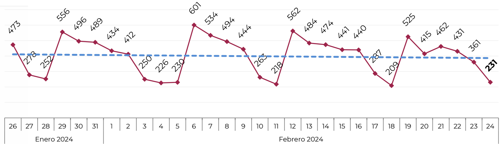
Acumulado por Zona de Vehículos Robados en 2018 , 2019, 2020, 2021, 2022, 2023 y 2024