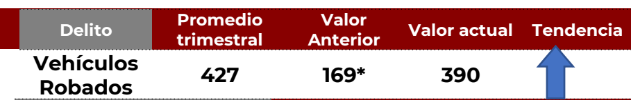
No. de Vehículos Robados (últimos 30 días)