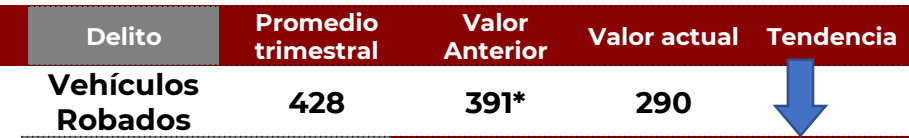
No. de Vehículos Robados (últimos 30 días)