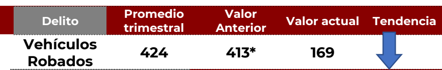
No. de Vehículos Robados (últimos 30 días)