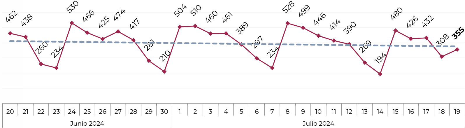
Acumulado por Zona de Vehículos Robados en 2018 , 2019, 2020, 2021, 2022, 2023 y 2024