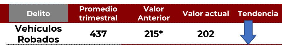
No. de Vehículos Robados (últimos 30 días)