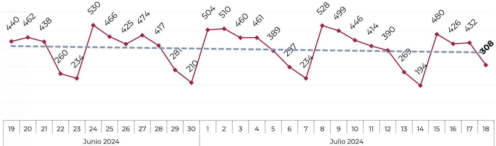
Acumulado por Zona de Vehículos Robados en 2018 , 2019, 2020, 2021, 2022, 2023 y 2024