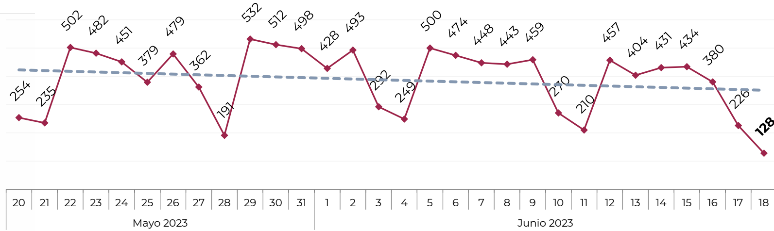
Acumulado por Zona de Vehículos Robados en 2018 , 2019, 2020, 2021, 2022 y 2023