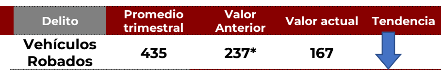
No. de Vehículos Robados (últimos 30 días)