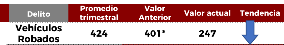
No. de Vehículos Robados (últimos 30 días)