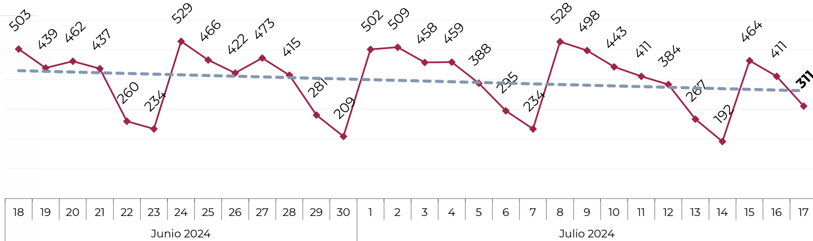
Acumulado por Zona de Vehículos Robados en 2018 , 2019, 2020, 2021, 2022, 2023 y 2024