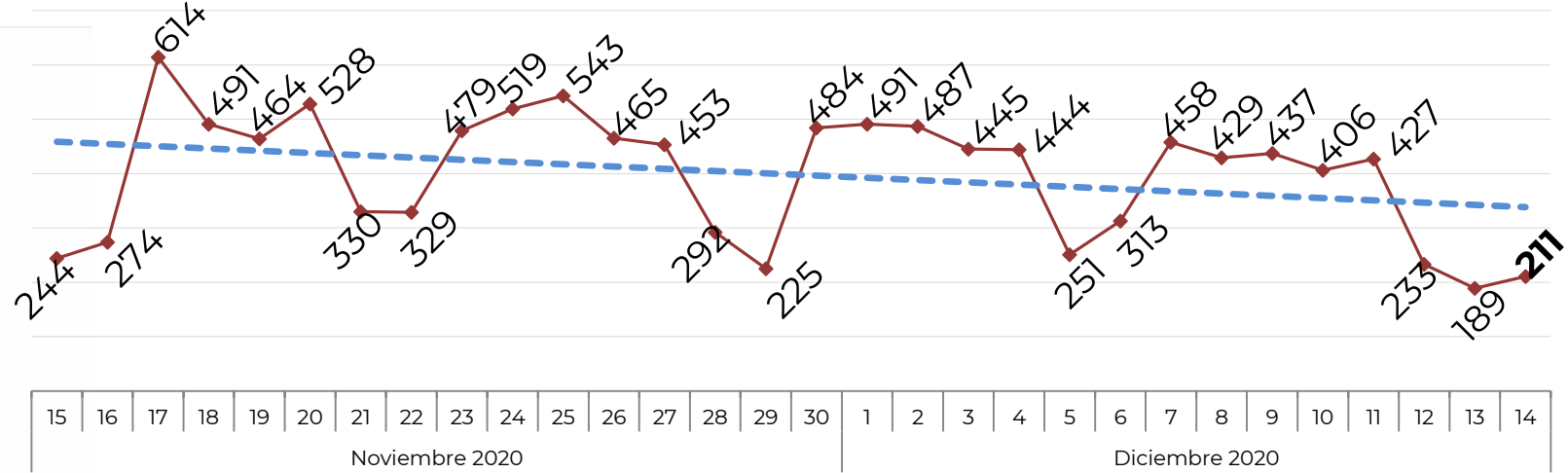
No. de Vehículos Robados (últimos 30 días)