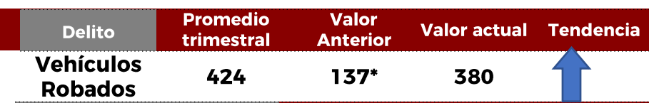
No. de Vehículos Robados (últimos 30 días)