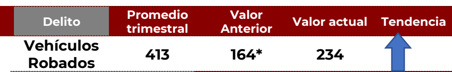
No. de Vehículos Robados (últimos 30 días)