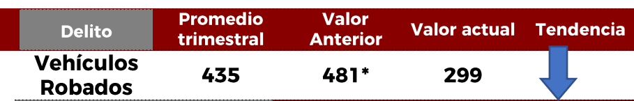
No. de Vehículos Robados (últimos 30 días)