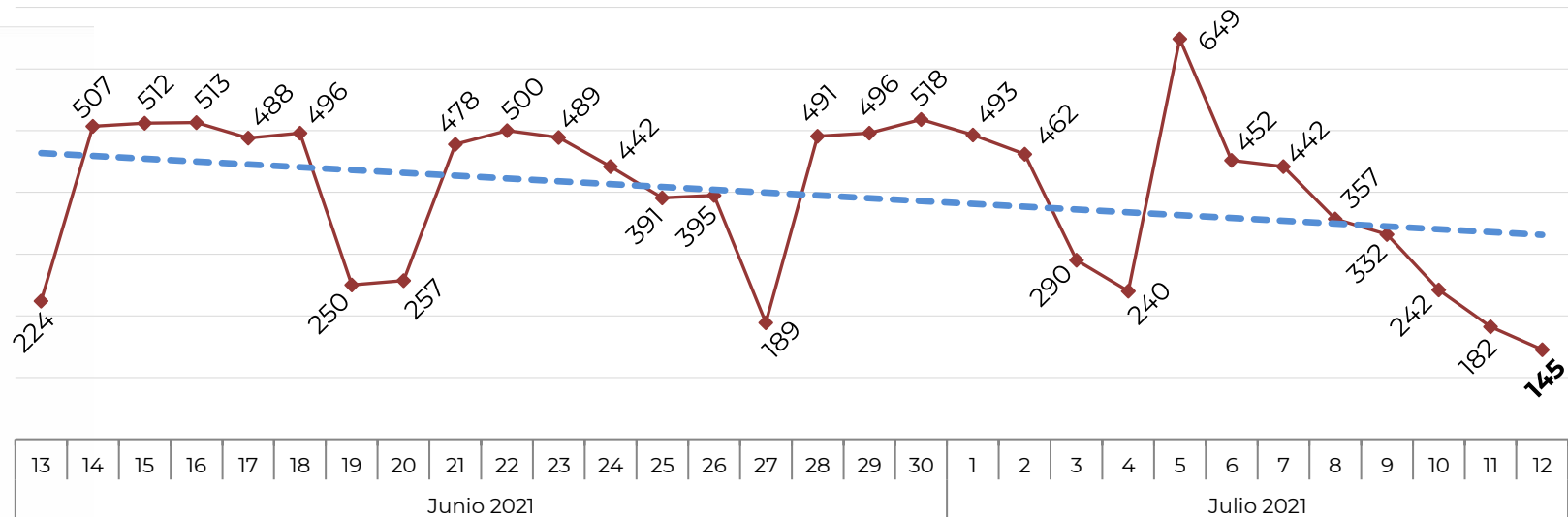
Acumulado por Zona de Vehículos Robados en 2018, 2019, 2020 y 2021