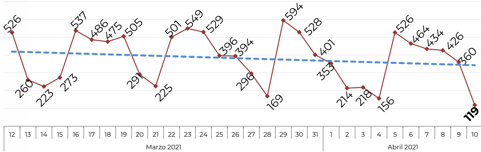
Acumulado por Zona de Vehículos Robados en 2018, 2019, 2020 y 2021