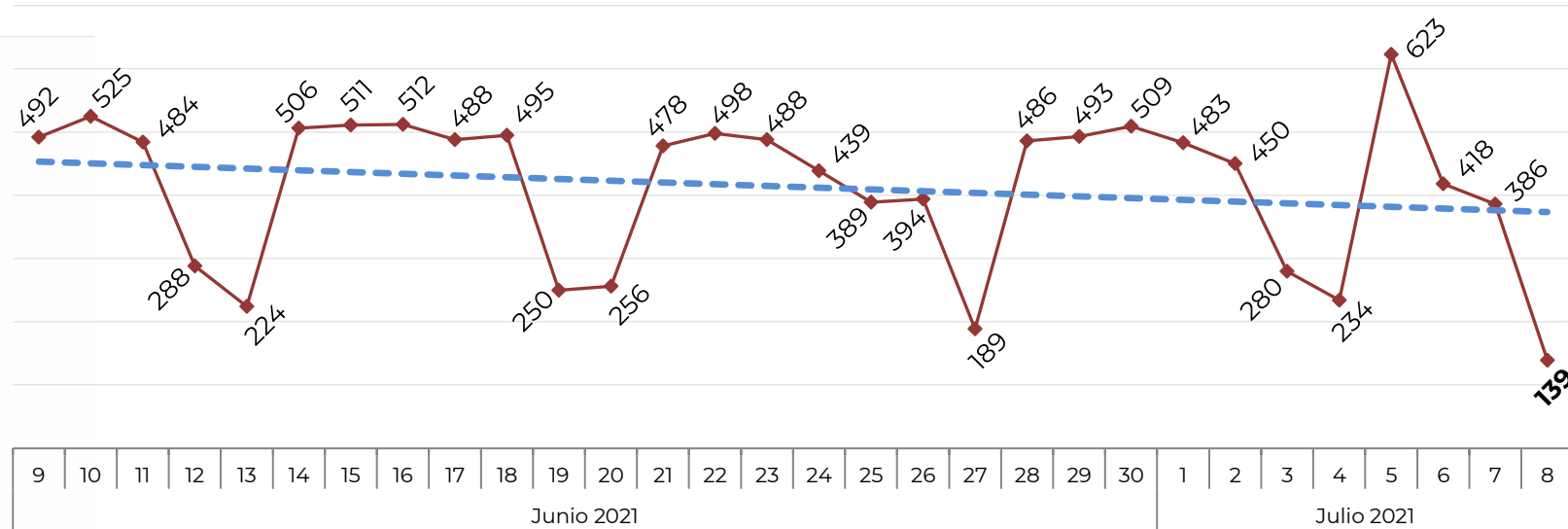
Acumulado por Zona de Vehículos Robados en 2018, 2019, 2020 y 2021