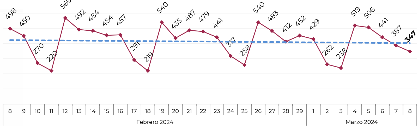
Acumulado por Zona de Vehículos Robados en 2018 , 2019, 2020, 2021, 2022, 2023 y 2024