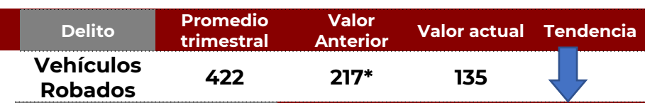
No. de Vehículos Robados (últimos 30 días)