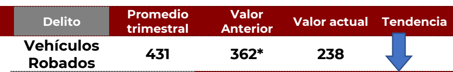
No. de Vehículos Robados (últimos 30 días)