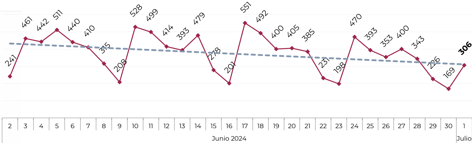
Acumulado por Zona de Vehículos Robados en 2018 , 2019, 2020, 2021, 2022, 2023 y 2024